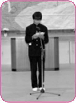
「誓いのことば」を述べて、中学生の自覚を持ちました。

次の日から6時間目もあるということ、お弁当を持って楽しみに中学校へ行きました。一時間が西小では45分でしたが、5分になって少し長いなーと思いました。そして、西中初めての体育では50m走をしました。西小と同じ長さなのに長く感じました。この3年間で大事に過ごしたいです。