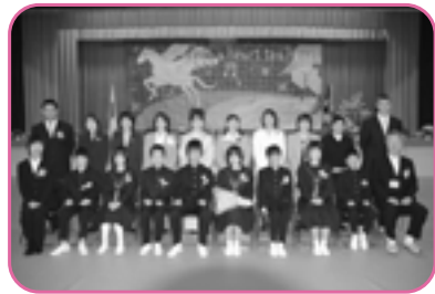
少し緊張しながらも、いい笑顔です。

中学校に入ると、授業時間が5分延び5分になりました。一つの授業が5分の差でも、1日と考えると30分もの差が中学校と小学校ではあります。午前中ではとんどの気力を使いきり、5、6時間目にすいませがやっ