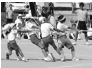
幼・小・中合同運動会