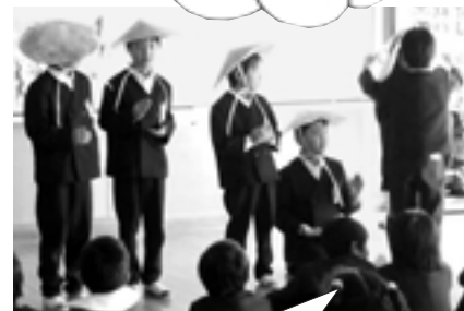
英語フェスティバル