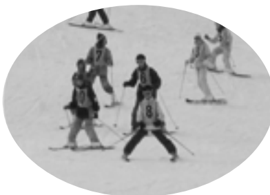
全校スキー（村内：大茅スキー場）