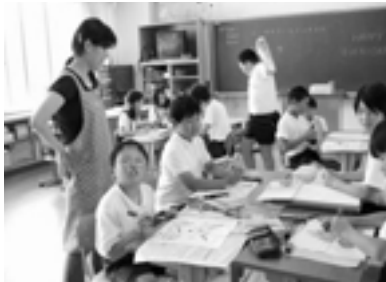
幼・小・中の連携