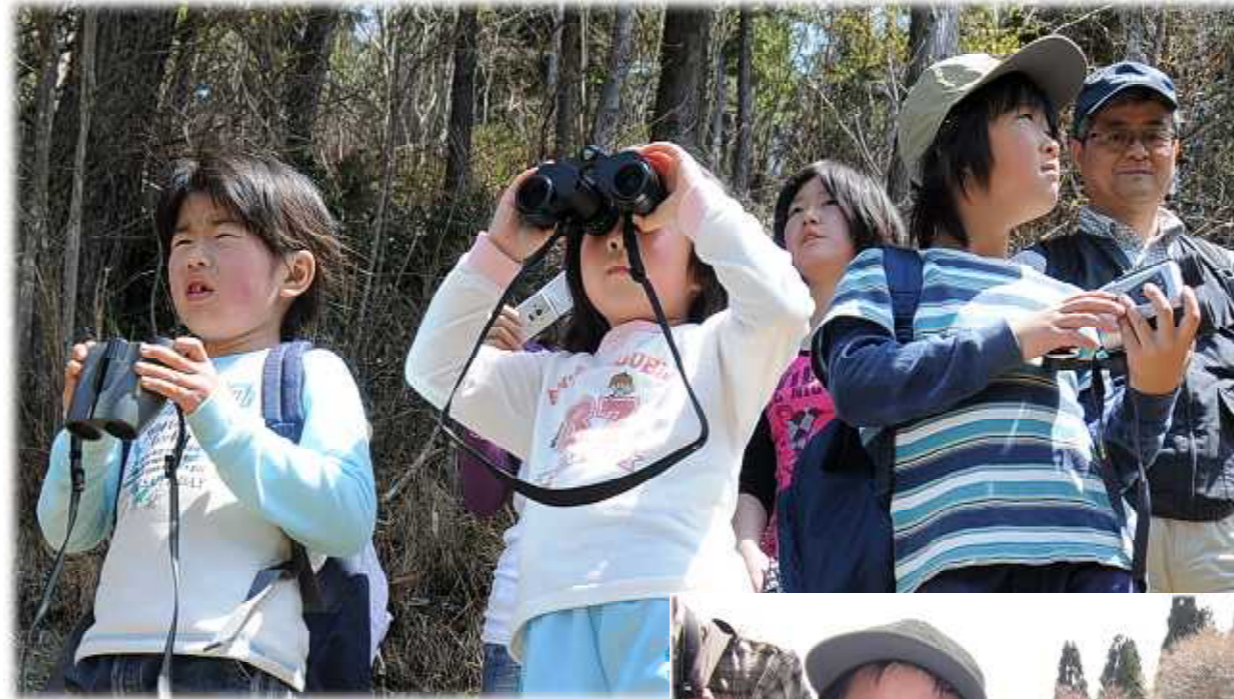
「なにが見えるかなー!？」