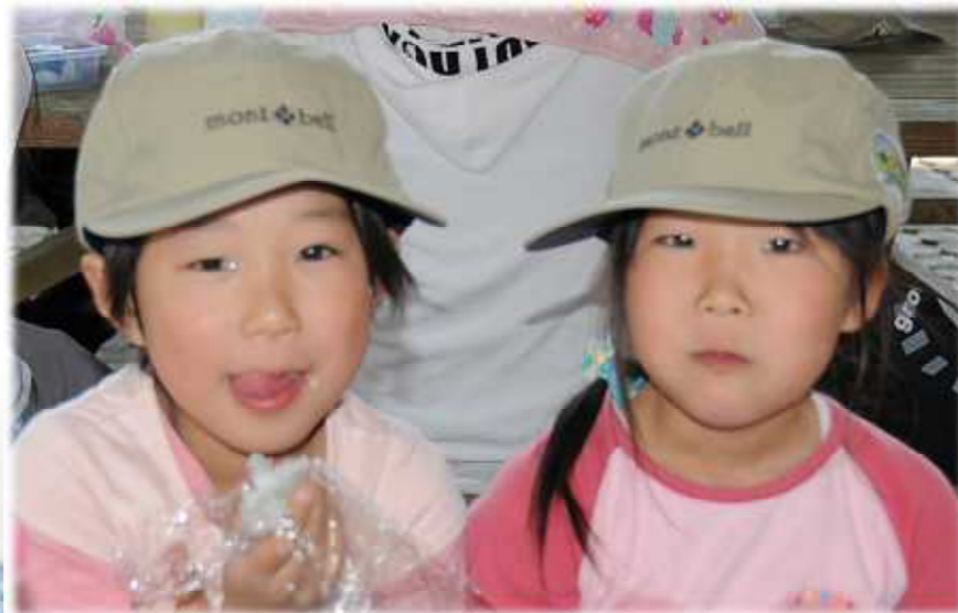
手作りのおにぎりって美味しいね