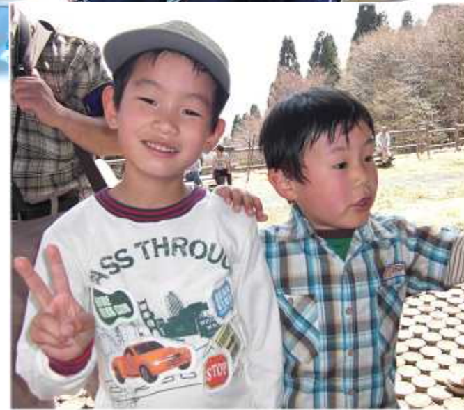
仲 良 し コ ン ビ