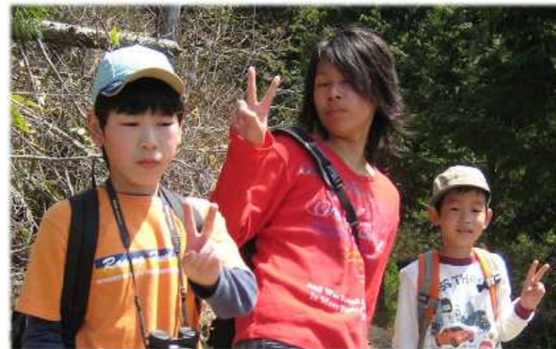
ピ ー ス