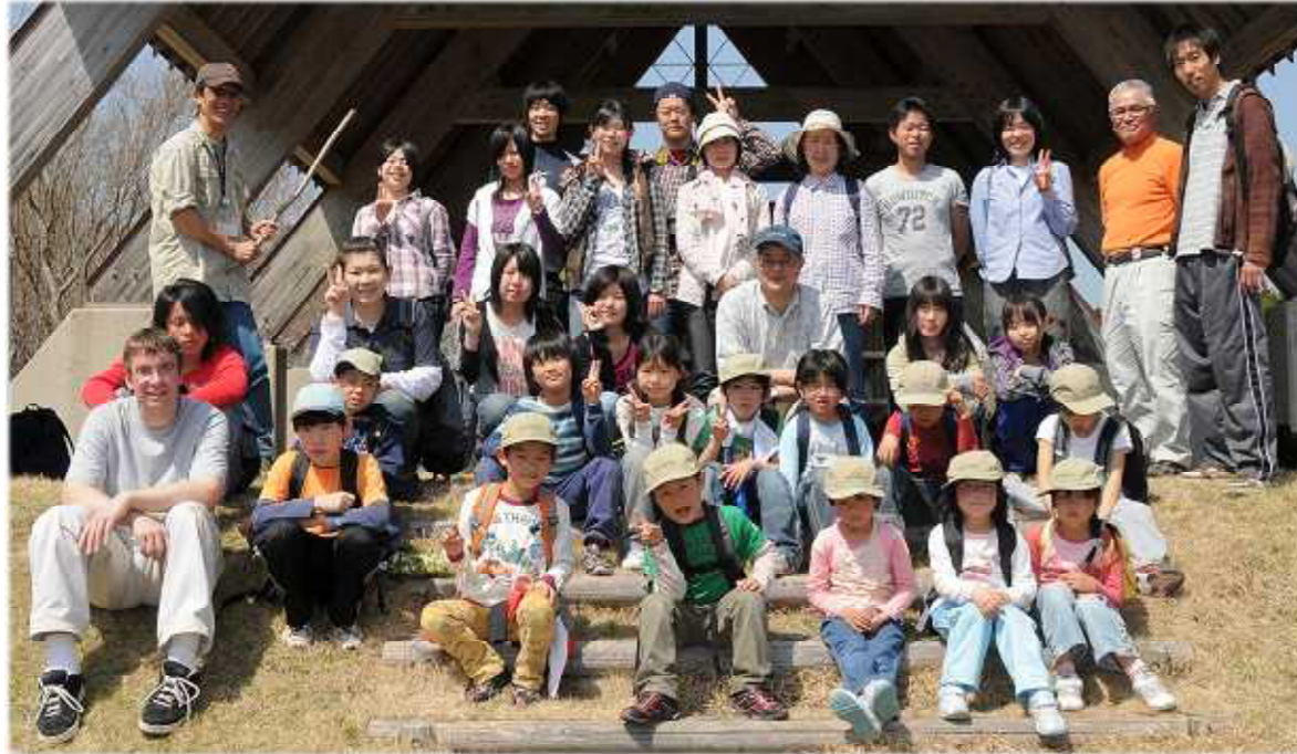
第 1 回 山 歩 き !