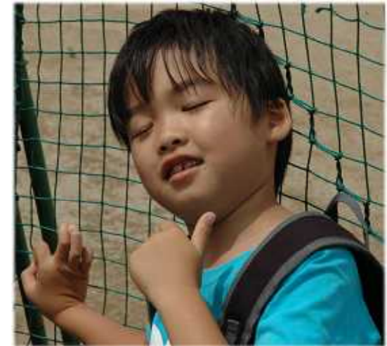
なんで日食が起こるの?