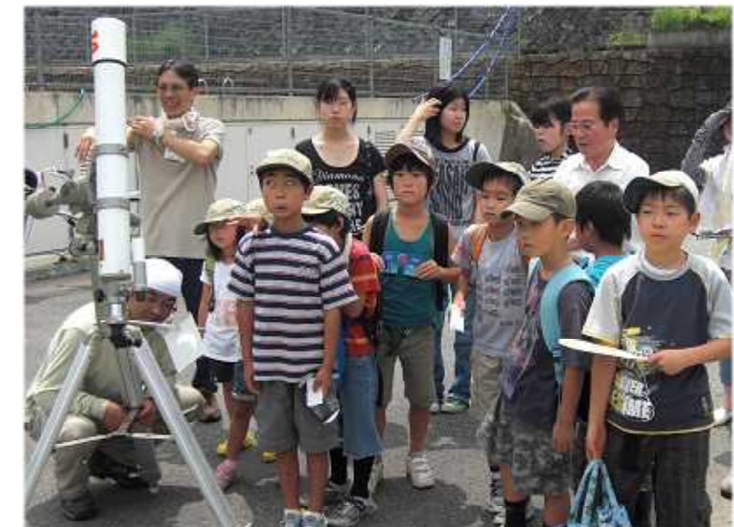
みんな見えたかな?