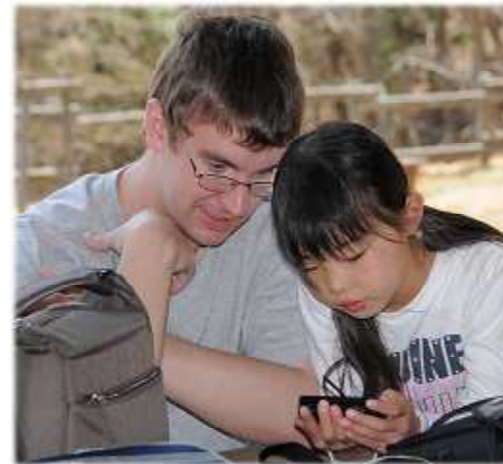
ちよっとひと休み。