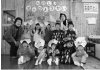
☆うさぎ組☆ 劇「三匹のこぶた」 踊り「ハロードラミちゃん」 「アヒルサンバ」