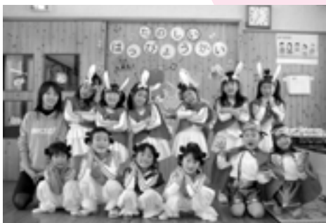
☆ぞう組☆ 劇「いなばのしろうさぎ」 踊り 「ぞうぐみ☆ソーラン」