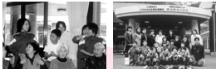
ゆうゆうハウスへ慰問に来ていただいた、小学校、幼稚園、ハッスル会の皆さん。

昨年、ぼんぼこ園、幼稚園、小・中学校、その他のいろいろな団体の皆さんが「ゆうゆうハウス」「ひだまり」を慰問してくださいました。利用者の方も大喜びでした。また、大変多くのボランティアの皆さんにご協力をいただき、ありがとうございます。