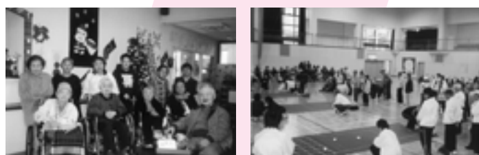
様々な行事、ボランティア活動でも、地域の方々にお世話になりました。