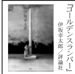
『ゴールデンズランバー』 伊坂幸太郎／評論社

さて、先日、2008年の「本屋大賞」が発表されました。この賞は、一部の批評家だけで選ばれるのではなく、全国の書店員さんが自分で読んで一番勧めたいと思った作品を投票して選ばれるものです。そのせいか、どれも読み応えのある、読後に何かが残る作品ばかり。ここにはトップ3をご紹介しますが、鬱陶しい天気を吹き飛ばすのにピッタリでは？