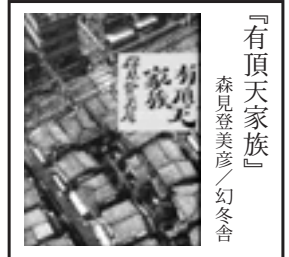
『有頂天家族』 森見登美彦／幻冬舎