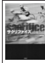
『サクリファイス』 近藤史恵／新潮社