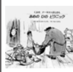
『あめのひのピクニック』 ガブリエルパンサンB1出版