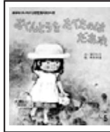
『おべんとうをたべたのはだあれ?』 神沢利子ひさかたチャイルド