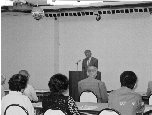
身体障害者福祉協会総会