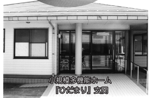
小規模多機能ホーム『ひだまり』玄関

皆さんから寄付いただきました『善意の窓口』を購入資金にさせていただきました。 “ありがとうございました”