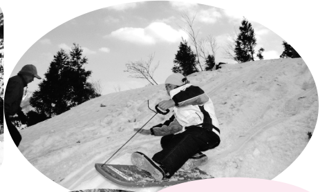
スノーサーフィンも角度が違います!