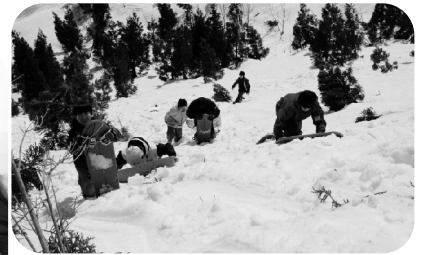
行きはよいよい、帰りは登り!降りたことを後悔するほどの...