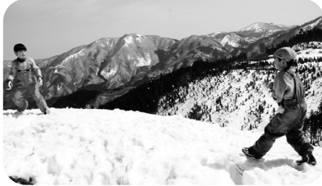
どうです?この絶景の中の雪合戦は!!