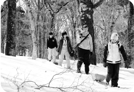
楽しいことにたどり着くまでには、長い長い道のりが...