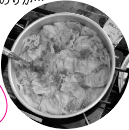
やっぱりお昼は、暖かいラーメン!!今回はワンタン入りだよ