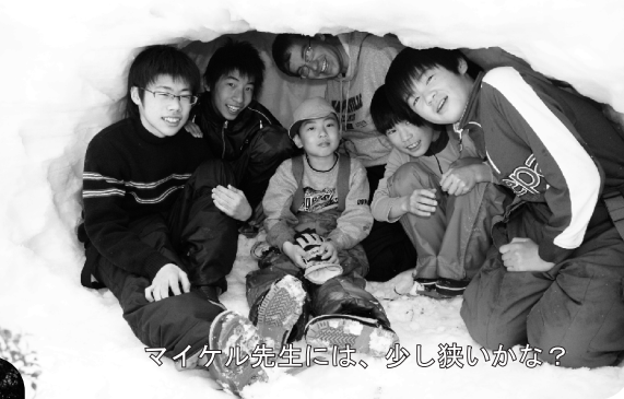
マイケル先生には、少し狭いかな?