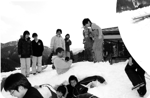
できあがったら、つぶさなきゃ!壊す時の方がいきいきしてる!?