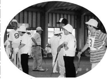
ゲートボール大会