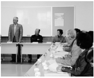
老人クラブ連合会総会