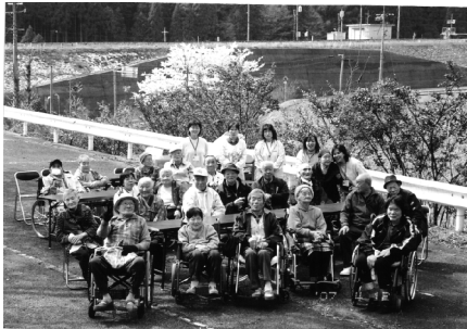
ゆうゆうハウス利用者花見