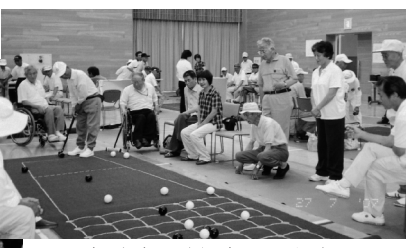
身障者囲碁ボール大会