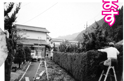
シルバー人材作業