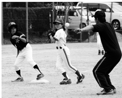
タッチの差でセーフ!!