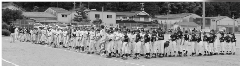
今年で8回目を迎えた本大会には、県内外から15チームが参加しました