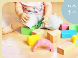
たのしい うれしい