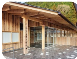
西粟倉産の木のぬくもりに囲まれた 優しいっぱいの園舎でお迎え！