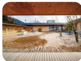
園舎に囲まれて安全な環境の中、 思いっきり外遊びを楽しめる中庭。 みんなの大好きな砂場や、かわいい丘もあるよ！