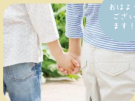
おはよう ございます！

●給食は季節の食材をとり入れ、子どもたちが 色々な食材と出会えるメニューを提供します。 また、一人一人の成長に合わせた食事に配慮します。