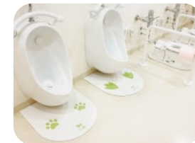
小さな子どもが楽しく、行ってみたい！ と思えるかわいいトイレ。