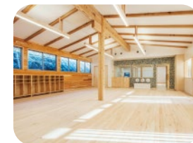
地域の資源を生かした冷暖房を利用したり、 西粟倉産のヒノキフローリングなど 環境に配慮された空間です。