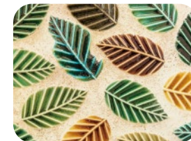
林業の村、西粟倉をイメージした オリジナルタイル！村に住んでいる生き物も かくれているので園の中で探してみてね。