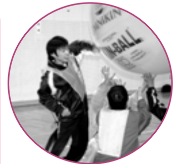
「オムニキン、ピンク!」