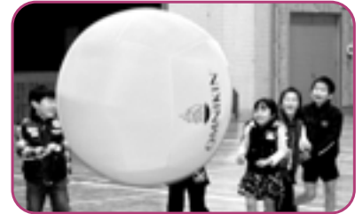
ハーフタイムには子どもたちもオムニキン!!