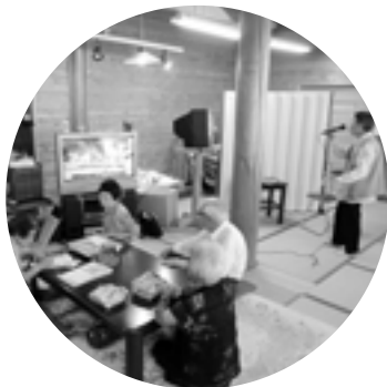
カラオケ会 (高齢者趣味の会)