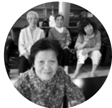
ロマン会 (ひとり暮らし老人の集い)

地区ごとに日にちを決めて、毎月1回、元湯や黄金泉にて活動しています。お風呂につかってお昼を食べ、みんなでワイワイしましょう!