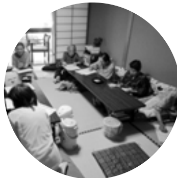
サテライト会 (元湯と黄金泉のデイサービス)

地区ごとに日にちを決めて、毎月1回、元湯や黄金泉にて活動しています。お風呂につかってお昼を食べ、みんなでワイワイしましょう!