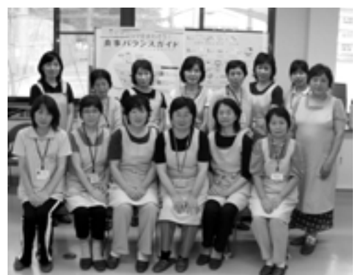
ヘルボラのみなさんです。