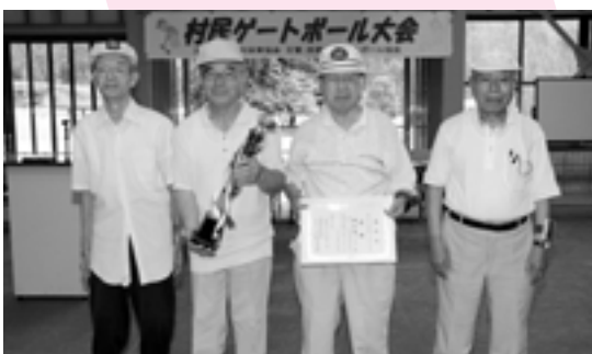
優勝 中土居チーム