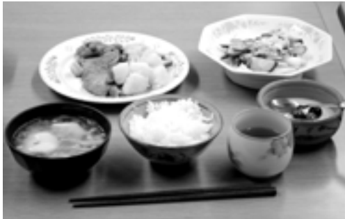
①ご飯 ②団子汁 ③豚肉の生姜焼き ④長芋の梅肉和え ⑤ババロア

7月13日(火)、ヘルスポランティア委員会主催の男の料理教室がいきいきふれあいセンターで開催されました。今回は『 バランス良く、薄味で 』をテーマに、男性が自らの健康を考え、食生活への関心を持ち、料理してもらおうと、ヘルスポランティアのみなさんと協力して5品の料理を完成させました。