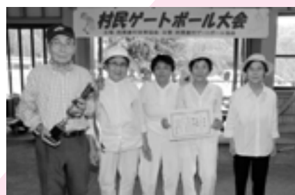
準優勝 猪之部チーム