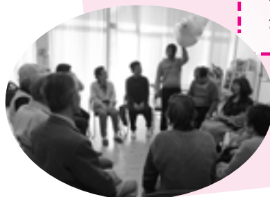
創作教室(ワハクラブ)