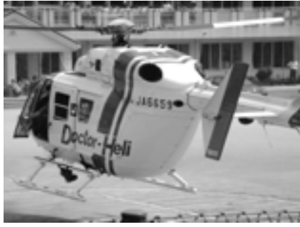
校庭に着陸するドクターヘリ

7月14日、ドクターヘリ・消防車・救急車を見学した3年生の子どもの達の感想です。