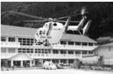
急患の発生で緊急に飛び立っていったドクターヘリ