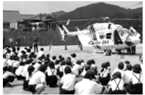
説明を受ける全校児童

ドクターヘリは遠くから見ても大きかったし、音もすごく大きかったです。二階のペランダのところまで砂が飛んできました。ドクターヘリの中には、い